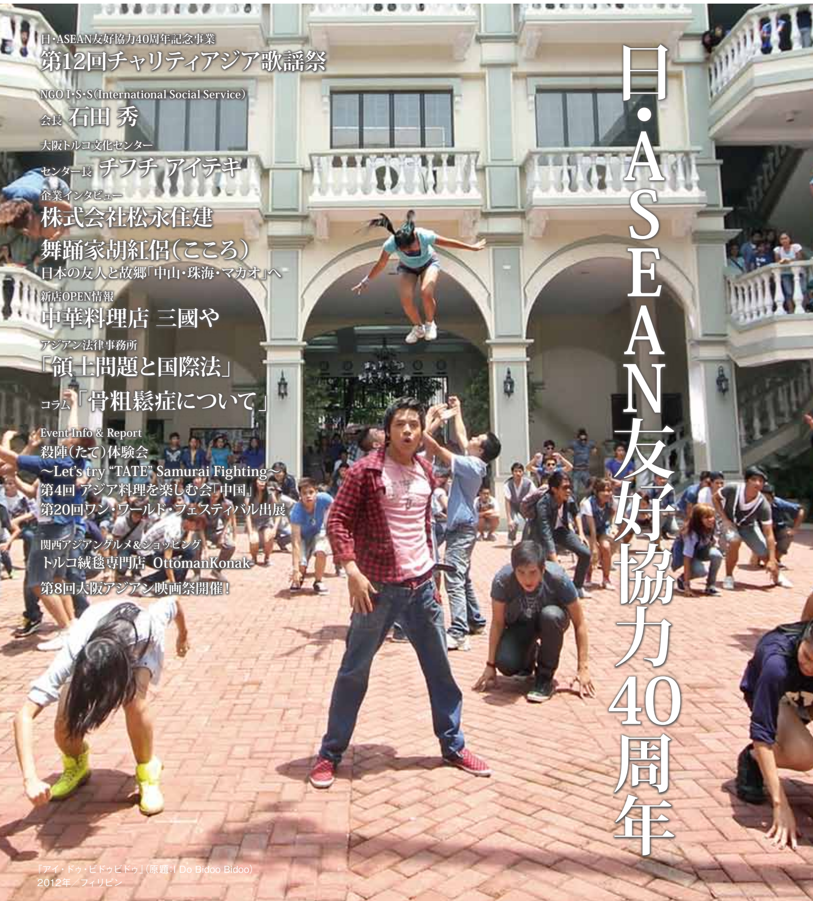
「アイ・ドウ・ビドゥビドゥ」(原題:I Do Bidoo Bidoo) 2012年/フィリピン