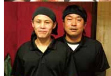
中華料理店 三國や 大阪市中央区高麗橋4-4-14 TEL & FAX 06-6226-0309